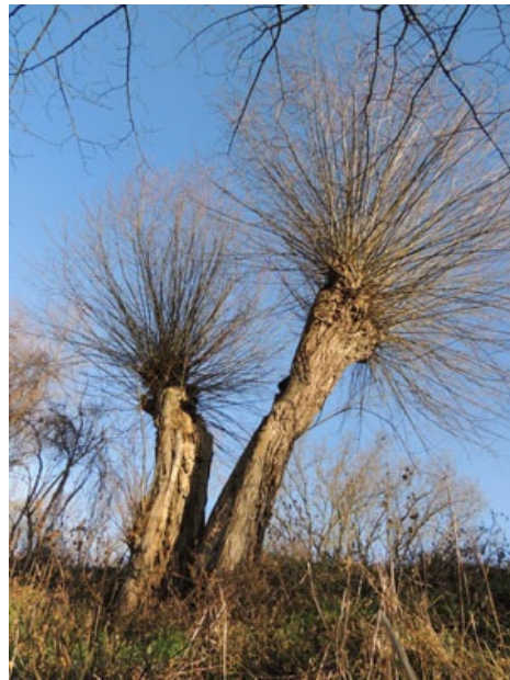
Kopfweiden Durch den regelmäßigen Rückschnitt der Ruten bis zum Stamm entstand die typische Form

Ziegenfutter, wie der botanische Name Salix caprea (capra = Ziege) verrät. Für die Bienen sind die schönen männlichen Kätzchen der Salweide erste ergiebige Futterquelle im zeitigen Frühjahr.